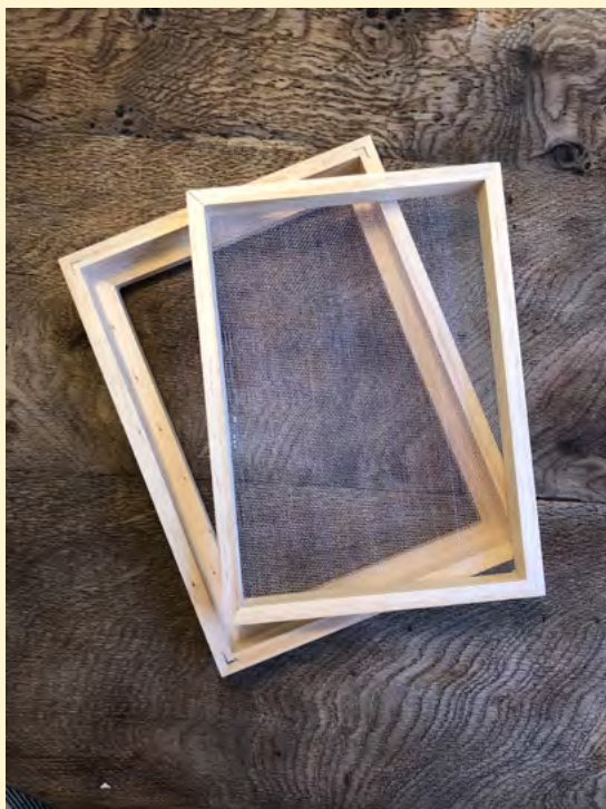
Rammer til papirstøbning. Den med net passer indeni den uden net.