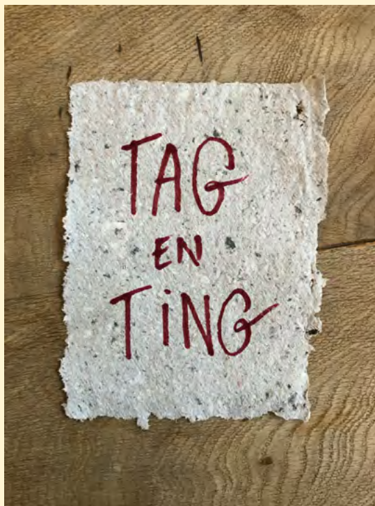
Det færdige papir.